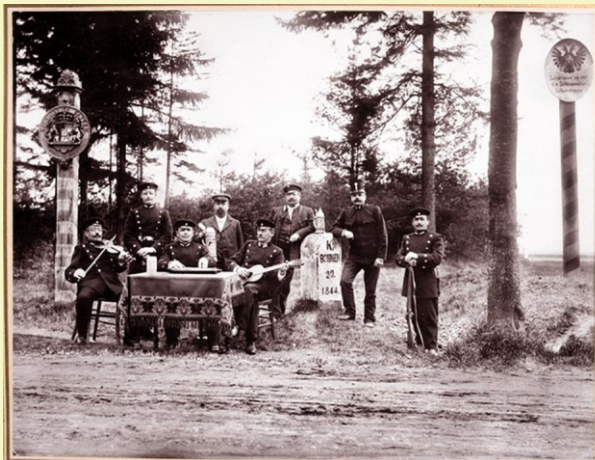
Grenzbeamte K&K Monarchie u. Bayern - gemeins. Feier a.d. Grenze