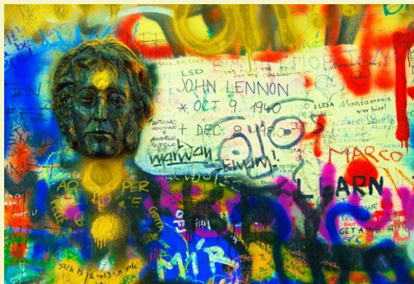
Prag (Kleinseite) - "Lennon-Mauer"

Wir bedanken uns bei unseren Ausstellern und Leihgebern: