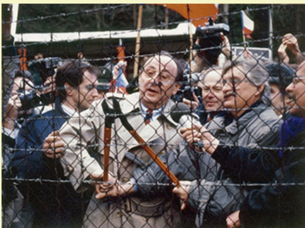
Aussenminister Genscher (D) und Dienstbier (CZ) - Grenzöffnung